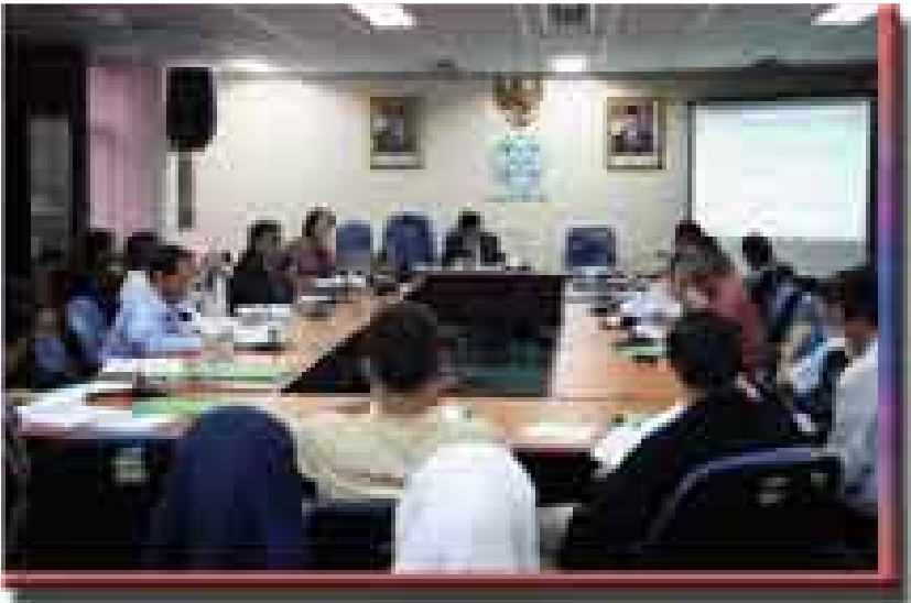
Foto-foto saat Pengesahan Standar Kompetensi Wartawan Jakarta, Selasa 26 Januari 2010

Perubahan Standar Kompetensi Wartawan dilakukan oleh masyarakat pers dan difasilitasi oleh Dewan Pers. ◆◆◆